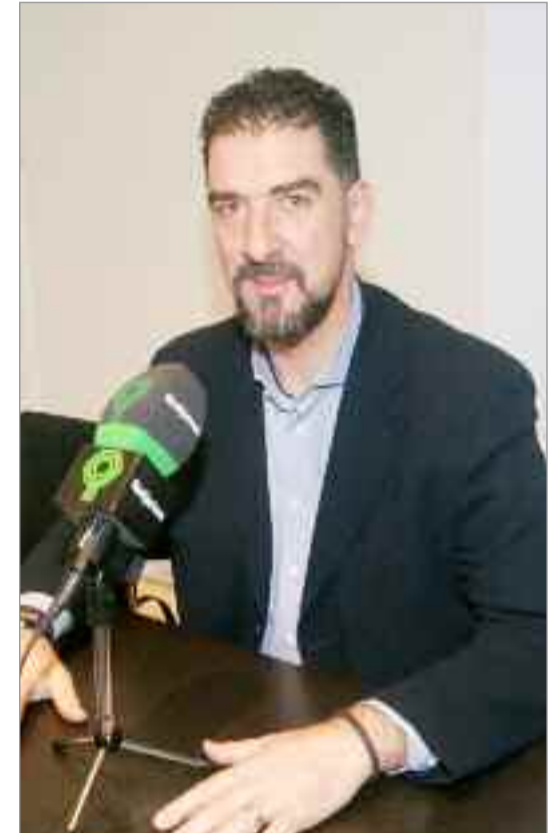
Esta inversión, que tiene un presupuesto de 171.352,30€ y un plazo estimado de ejecución de 3 meses

sentido de circulación que se reubicarán para situarse pasado el paso de peatones con objeto de facilitar la movilidad y la seguridad por visibilidad en los pasos de peatones.