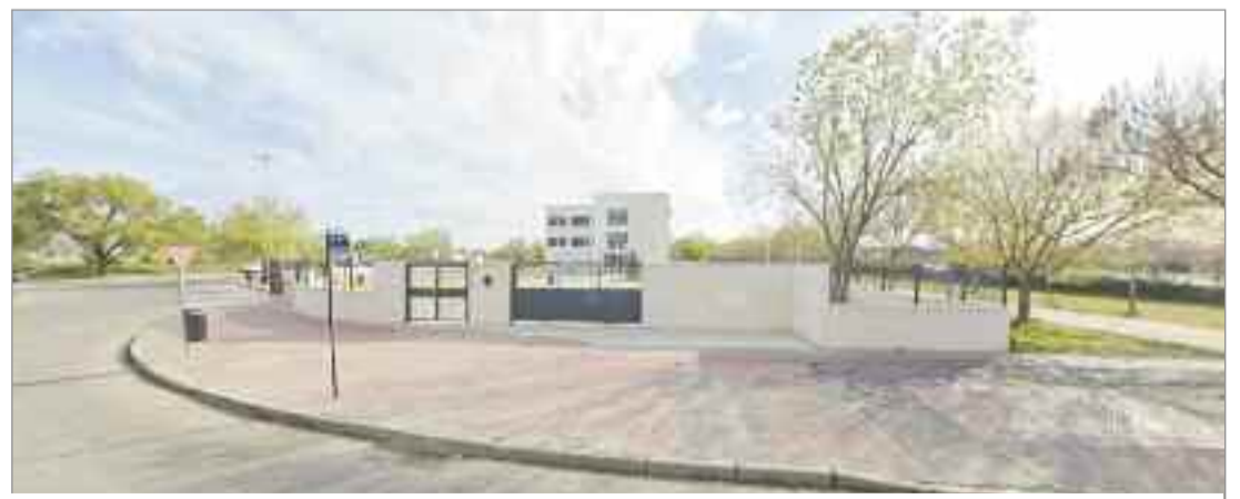
La actuación completará la mejora de la accesibilidad y seguridad vial que ya se inició en la Avenida Juan Carlos I

• Conexión de los espacios verdes interbloques: los espacios verdes de la zona de interbloques se cortan al encontrarse con la calzada en la calle Jorge Juan, por lo que se generará un paso de peatones alineado con la zona verde de forma que se dé continuidad en todo el paseo. Para la ejecución de estos pasos se adelantará la acera consiguiendo que el paso quede en línea con el aparcamiento. Para ello se instalará un paso elevado adoquinado y equipado con señalización vertical de paso de peatones.