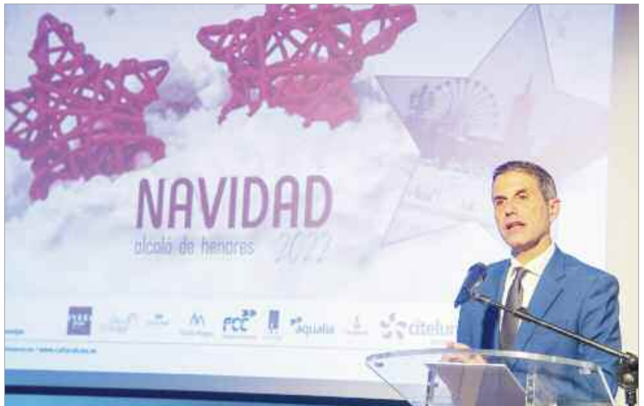
En el afán del equipo de Gobierno de descentralizar la actividad cultural y de que las propuestas lleguen a todos los barrios

Hospitalillo, la Casita del O'Donnell o la escalera de la Escolapias, que vuelve a sumarse a la programación esta Navidad y abre sus puertas para que el público pueda conocer el espacio y asistir a la narración de cuentos e historias de Navidad así como a actuaciones de diversos coros". Y también como atractivo principal de las Navidades, los más pequeños podrán disfrutar de los desfiles de la Comparsa de Gigantes y Cabezudos, que recorrerá todos los barrios, y también visitará el Hospital de Antezana, cuyo Cabildo se suma a la celebración de la Navidad ofreciendo distintas actividades como un recital de Villancicos o la representación de un entremés cervantino de la mano del TIA.