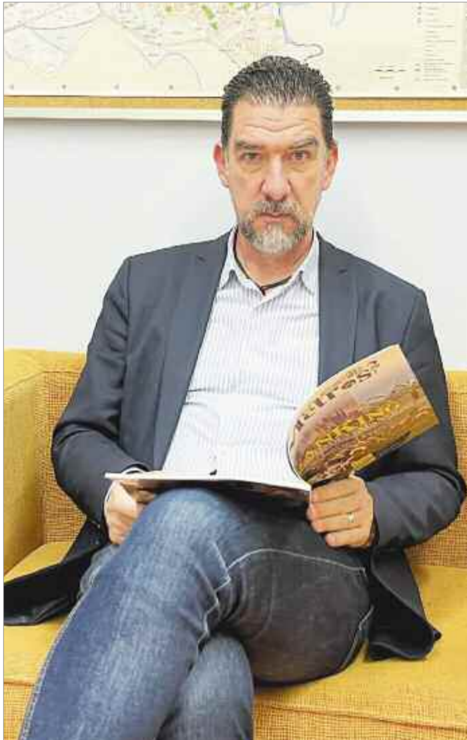
El segundo teniente de alcalde es un apasionado de su ciudad, del deporte, del senderismo y de la naturaleza, como se refleja en las muchas propuestas de medioambiente que se están llevando a cabo en la ciudad.

Va a contar con 10 kilómetros de itinerario peatonal entre los barrios de La Garena, IVIASA, El Chorrillo, el Ensanche y Ciudad del Aire. Va a discurrir por toda la zona norte de la ciudad, y va a unir los espacios naturales como el Parque Félix Rodríguez de la Fuente hasta llegar al Corte Inglés, en la zona de La Garena. Es un proyecto de cerca de 1,5 millones de euros de fondos totalmente municipales. En enero empiezan las