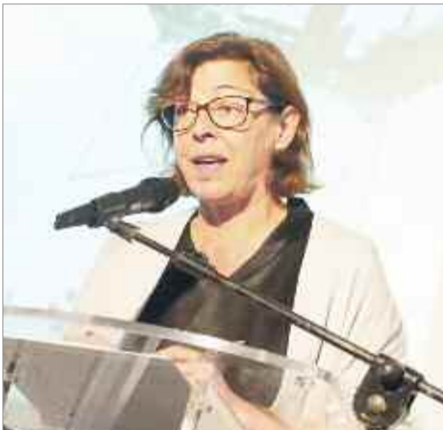
La Casita del O'Donnell acogerá también una amplia programación para público infantil con talleres, gincanas, cuenta cuentos, que arrancará durante el puente de diciembre

Volverá a ser protagonista de la Navidad en Alcalá la "Asociación Complutense de Belenistas", que celebra este año el XXV Aniversario de su colaboración con el Ayuntamiento. Como cada año han preparado el Belén Tradicional, que se podrá visitar en la Casa de la Entrevista, y el Gran Belén Monumental que ocupará la "Antigua Fábrica Gal". Además, han promovido la XXXIX edición del Concurso de Belenes, con inscripciones abiertas hasta el 20 de diciembre. Aranguren resaltó que estas Navidades se podrán efectuar diversas rutas "que nos lleven a recorrer las diversas propuestas culturales que se ofrecen en la ciudad, partiendo del arco de luz que cubrirá la calle Libreros y que ofrecerá pases distintos de luz y sonido cada 20 minutos, podremos llegar hasta la Plaza de Cervantes y desde ahí llegar a los distintos puntos que ofrecen propuestas como la Plaza de los Santos Niños, el